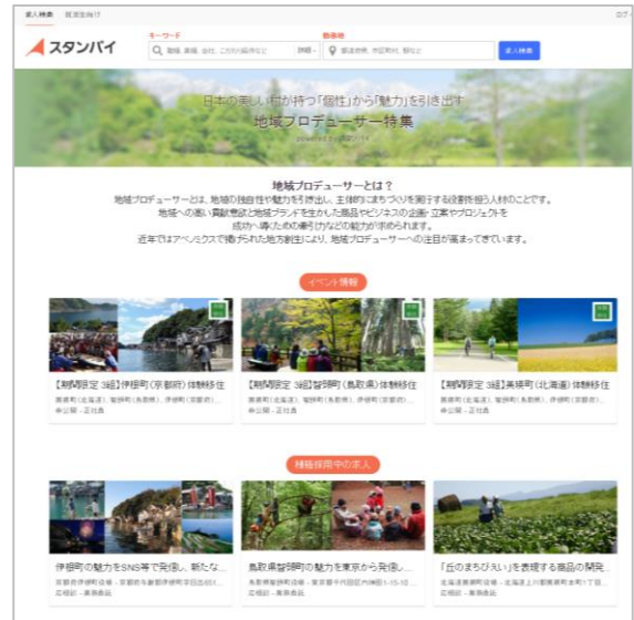
特設ページの一部

募集特設ページ URL： https://jp.stanby.com/feature/producer