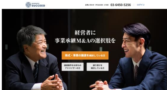
「ビズリーチ・サクシード」トップページ

また、譲り受け企業は興味をもった譲渡企業へ直接アプローチできるため、譲渡企業にとっては、潜在的な資本提携先の存在や、自社の市場価値を把握するきっかけになります。2017年11月下旬にサービスを開始し、2018年1月現在、全国の事業承継 M&A 案件が570件以上登録され、事業承継 M&A プラットフォームにおいて日本最大級の案件数となっています。