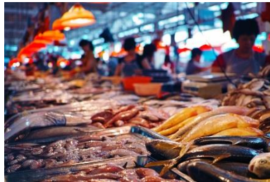
生鮮マーケットイメージ