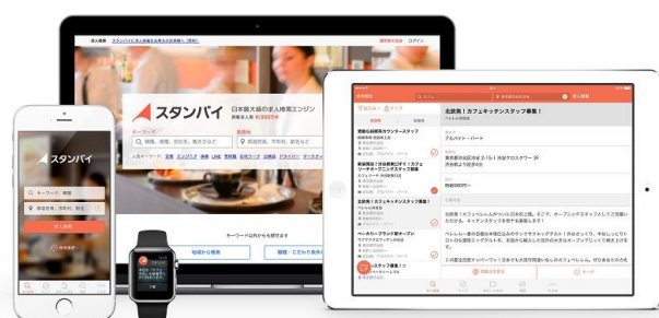
「スタンバイ」では検索窓にキーワードを入れると 400 万件超の求人情報から検索できる

スタンバイは、国内の全業種・全職種・全雇用形態を対象にした日本最大級の求人検索エンジンです。スマートフォンなどの GPS 機能を活用した「地図」からの検索や、職種・業種などの「キーワード」と希望の「勤務地」を組み合わせた検索により、複数の大手求人サイトの求人を横断して一括検索できます。検索可能な求人件数は 400 万件を超え、いつでもどこでも、自分に合った求人を効率的に検索することが可能です。一方、企業や地方自治体、各種団体は無料で求人ページを作成・公開・