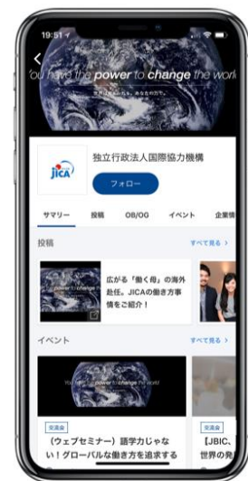
企業ページイメージ

国内外の多様なステークホルダーとともにプロジェクトを進行していくため、国際協力の道に進みたいという学生だけではなく、グローバルに活躍したいという学生も JICA に興味・関心を抱いています。しかし、事業が多岐にわたるため、「仕事内容がイメージしづらい」という声が寄せられていました。そこで、学生と JICA 職員が近い距離で接するなかで仕事や働き方への理解を深める機会を創るため「ビズリーチ・キャンパス」を導入します。企業ページを通じて、JICA に関するメディア掲載記事やオリジナル記事などの情報の発信や、OB/OG が登壇する座談会の開催等を通じて、仕事内容を理解してもらえる機会を創出してまいります。